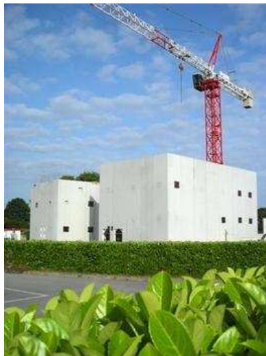
Chaufferie collective bois à Châteaubriant

Les 3 Communautés de Communes réunies au sein du Syndicat Mixte ont financé la réalisation d'une étude en 2006 qui a permis d'identifier tous les gisements de ressources du Pays de Châteaubriant valorisables économiquement et établir un programme d'actions portées par les entreprises ou les collectivités qui a candidaté à l'aide du Pôle d'Excellence Rurale.