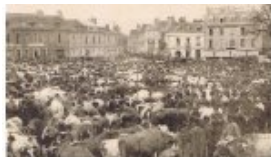
Marche-Motte Marché Place de la Motte

Sur la Place de la Motte : c'était un joyeux fouillis de bovins, de maquignons en chapeau et blouse, de vachères et de bétailières. Les dernières transactions se faisaient environ vers 13 h. Le meuglement des animaux, les cris des paysans quand une bête était rétive ou s'échappait : tout un concert. Chaque animal était examiné soigneusement : le nombre de dents, le dos, de l'épaisseur de la peau, le marquage du cul... tout était argument pour négocier le prix.