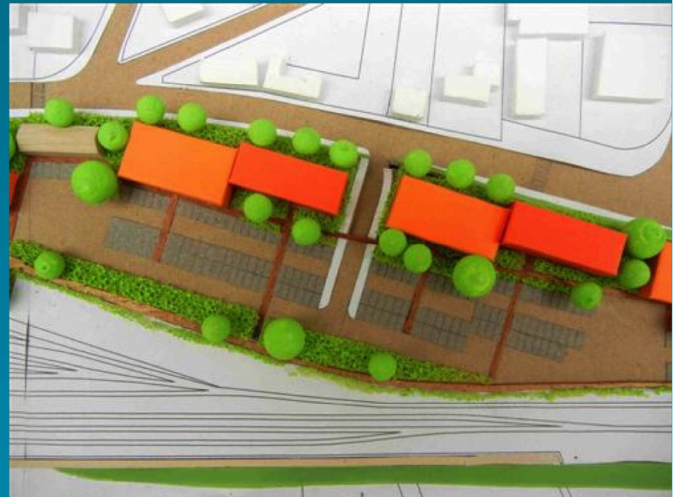
Maquette du futur quartier tertiaire proche de la gare terminus tram train de Châteaubriant