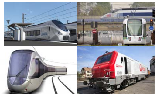
Coradia Polyvalent – Citadis de Paris - TGV Tram train Citadis Dualis – Locomotive Prima