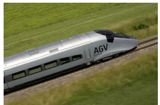
L'AGV, 4e génération de train à très grande vitesse, conçu et développé à La Rochelle