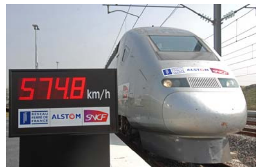
Record de vitesse mondial sur rail, battu le 2 avril 2007 par la rame V150 conçue dans les centres d'excellence français d'Alstom